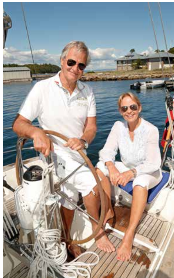
ELSKER BÅTLIVET: Ekteparet ombord i seilbåten. Der trives de aller best.

Tidligere hadde de ikke hørt så mye om disse turene til Antarktis, men nå er det drømmereise nummer én.